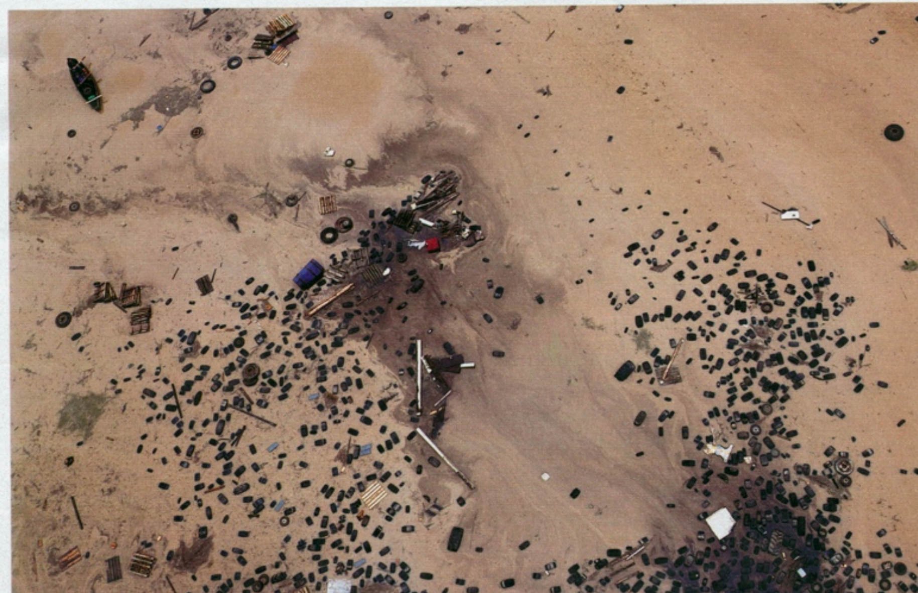
20.05.2010 Opony porwane przez wodę