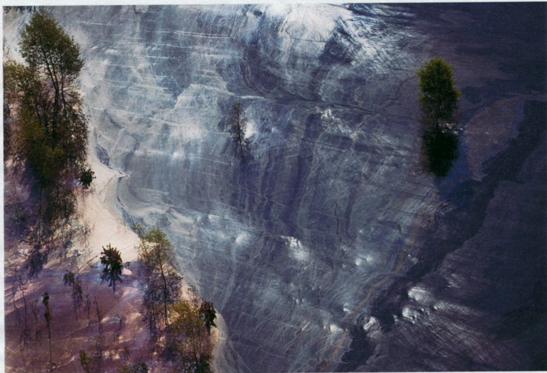
11.06.2010 Woda zanieczyszczona ropą