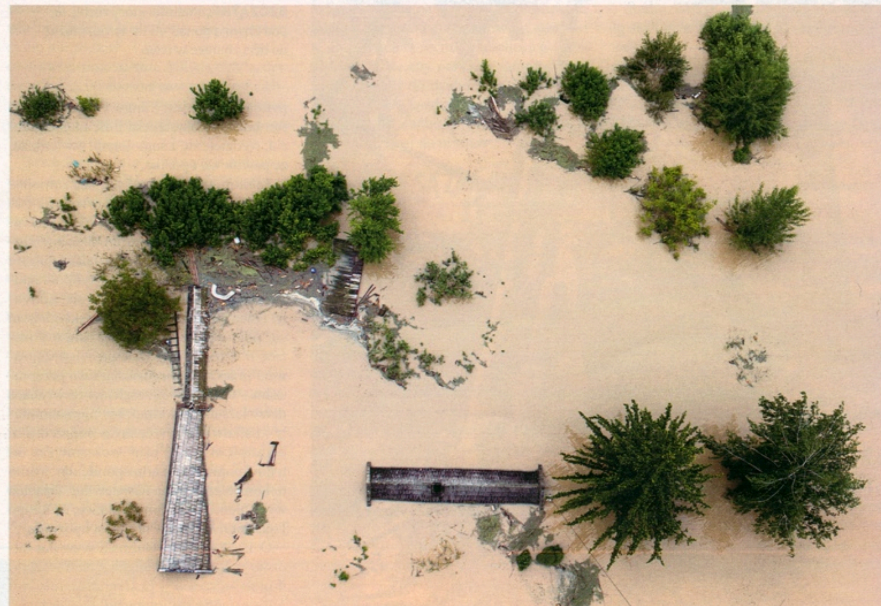
20.05.2010 Zalane domy